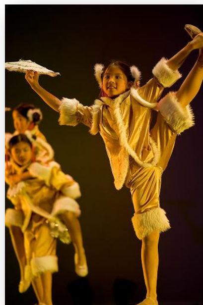
RACL 舞蹈班学生的可爱表演

CAFA 2010 年新年晚会更多照片，请见 http://www.flickr.com/photos/jpyang/sets/72157623544908726/