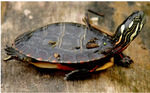
这是我爸爸捉的那种：Chrysemys , Painted Turtle。