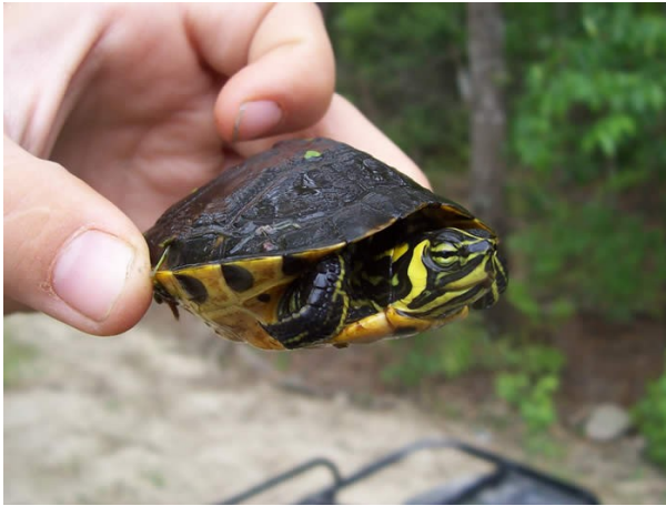
这个就是我朋友的爸爸捉到的那种乌龟：Yellow Belly Slider。