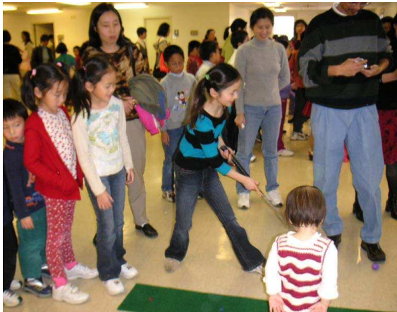
丰富多彩的游戏令孩子们玩儿得很开心