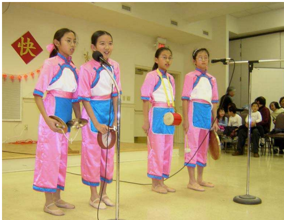
学生们表演三句半